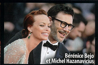
Bérénice Bejo et Michel Hazanavicius

GRUPE PRISMA MEDIA M 01800 - 977 - F: 2,20 €